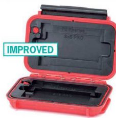
* memory Card Case for video