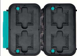
* memory card case