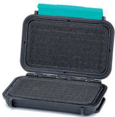
* cubed foam